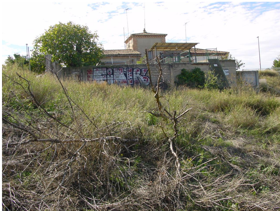
Imaagen nº6: Panorámica de "Almenara Nº 5ª del Pilar".