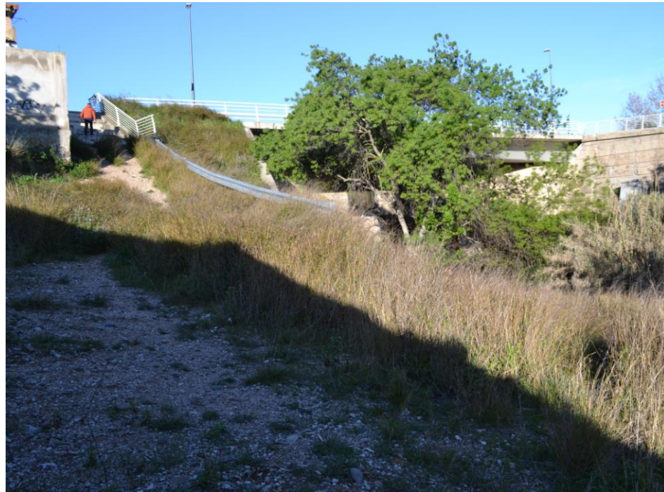
Imagen nº5: Vista acceso y plataforma acondicionamiento Ojo del Canal