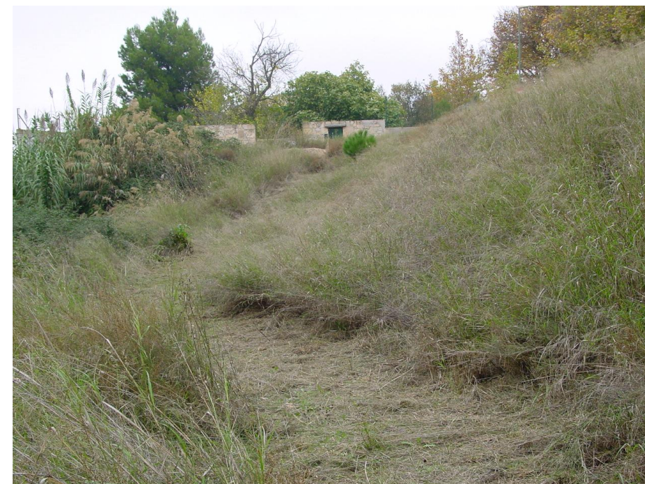
Imagen nº12: Vista trazado andadores inferiores margen derecha