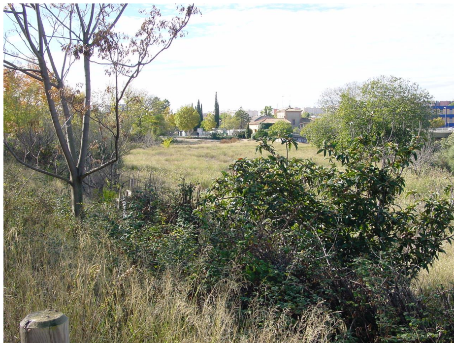
Imagen nº2: Vista antigua zona de Huertas.