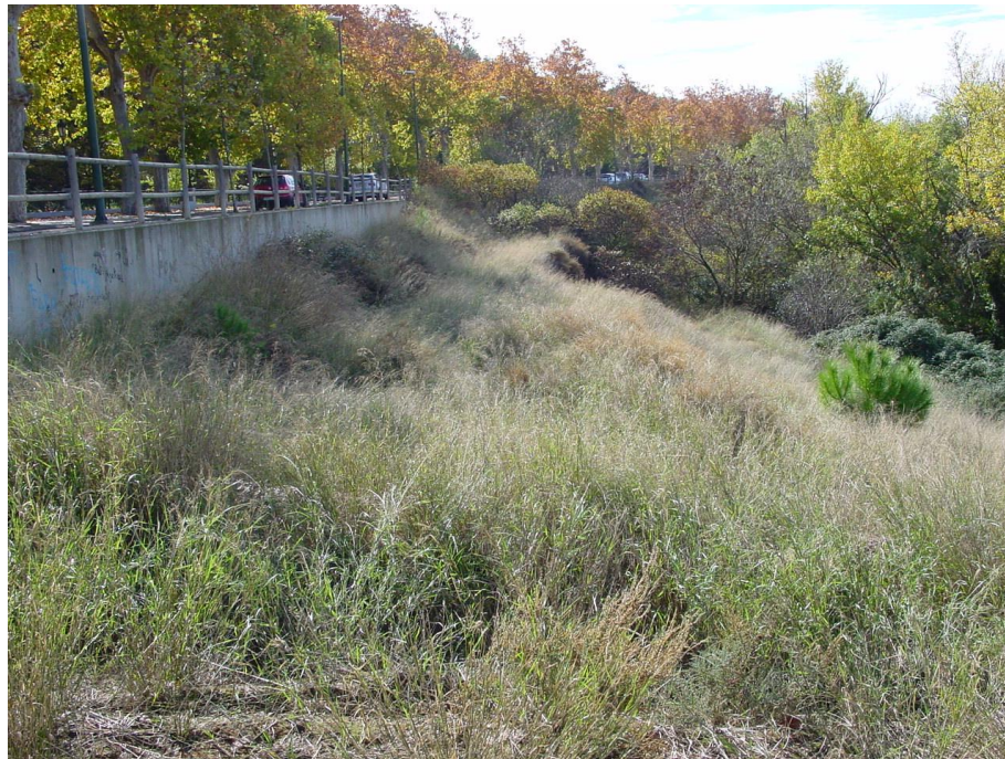
Imagen nº1: Vista ladera margen derecha. Andador.