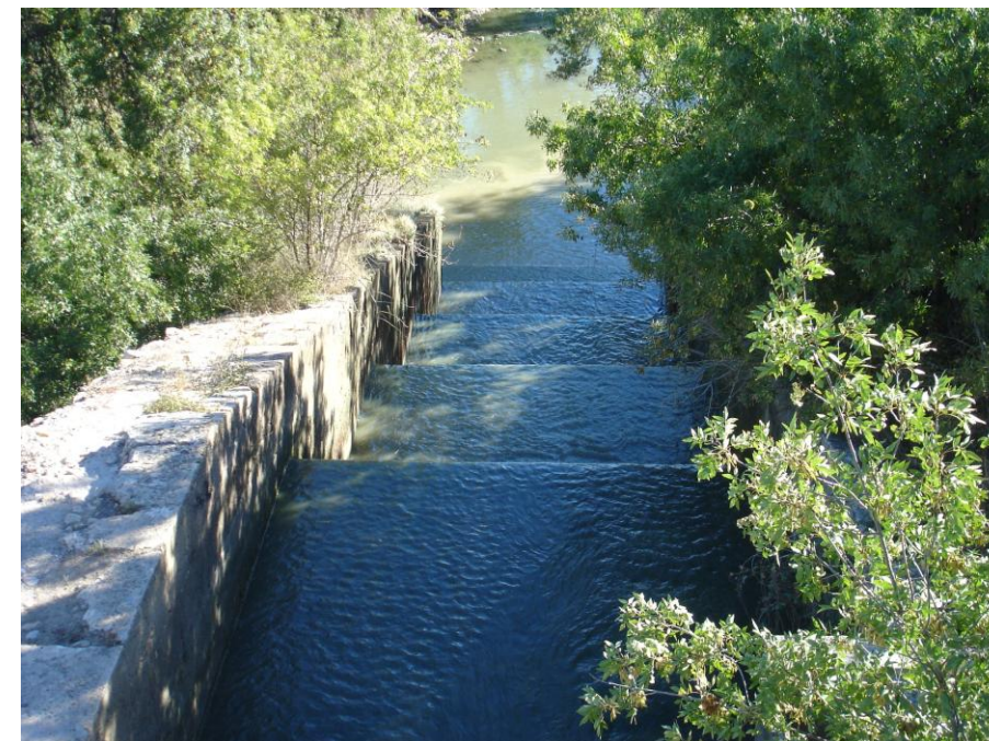
Imagen nº4: Infraestructura hidráulica de vertido: "Ojo del Canal"