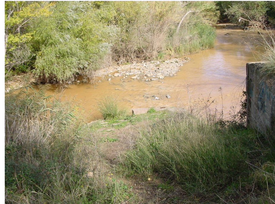
Imagen nº7: Vista Cauce del río Huerva desde el Canal de descarga