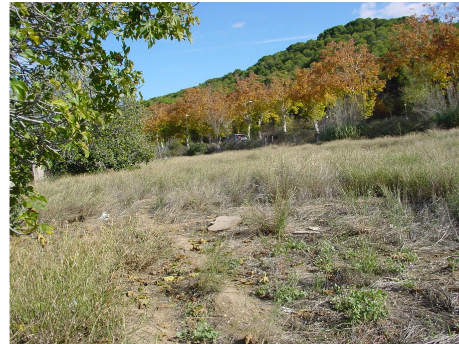
Imagen nº3: Margen derecha. Antigua zona de Huertas de Confederación Hidrográfica del Ebro