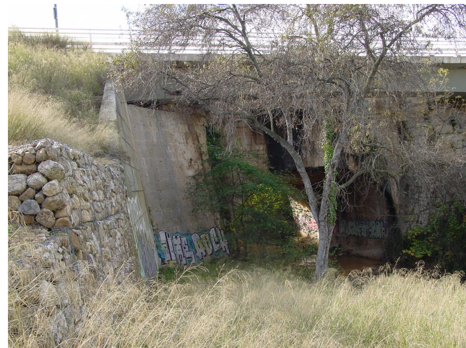
Imagen nº8: Vista acceso Ojo del canal