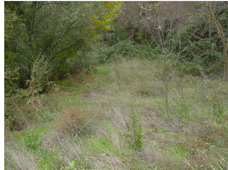
Imagen nº11: Vista plataforma caminos inferiores