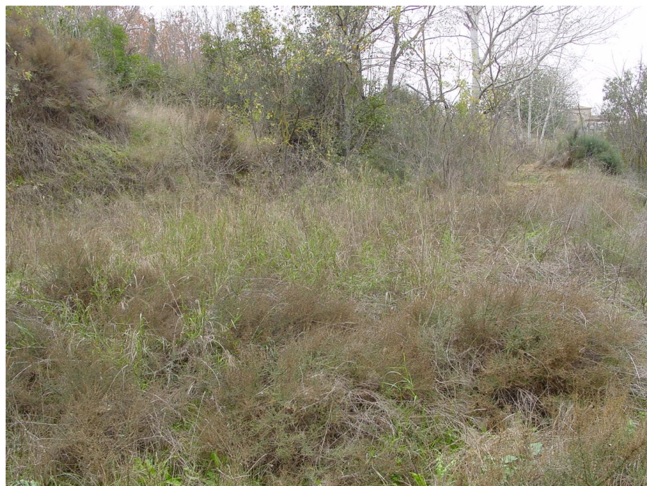
Imagen nº10: Vista plataforma caminos inferiores