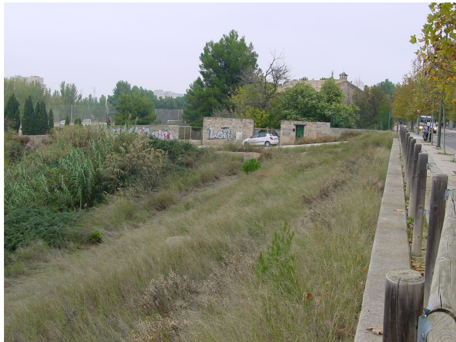
Imagen nº9: Vista trazado andadores desde Paseo Canal